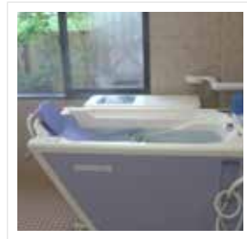
● 特浴 (車イス式)