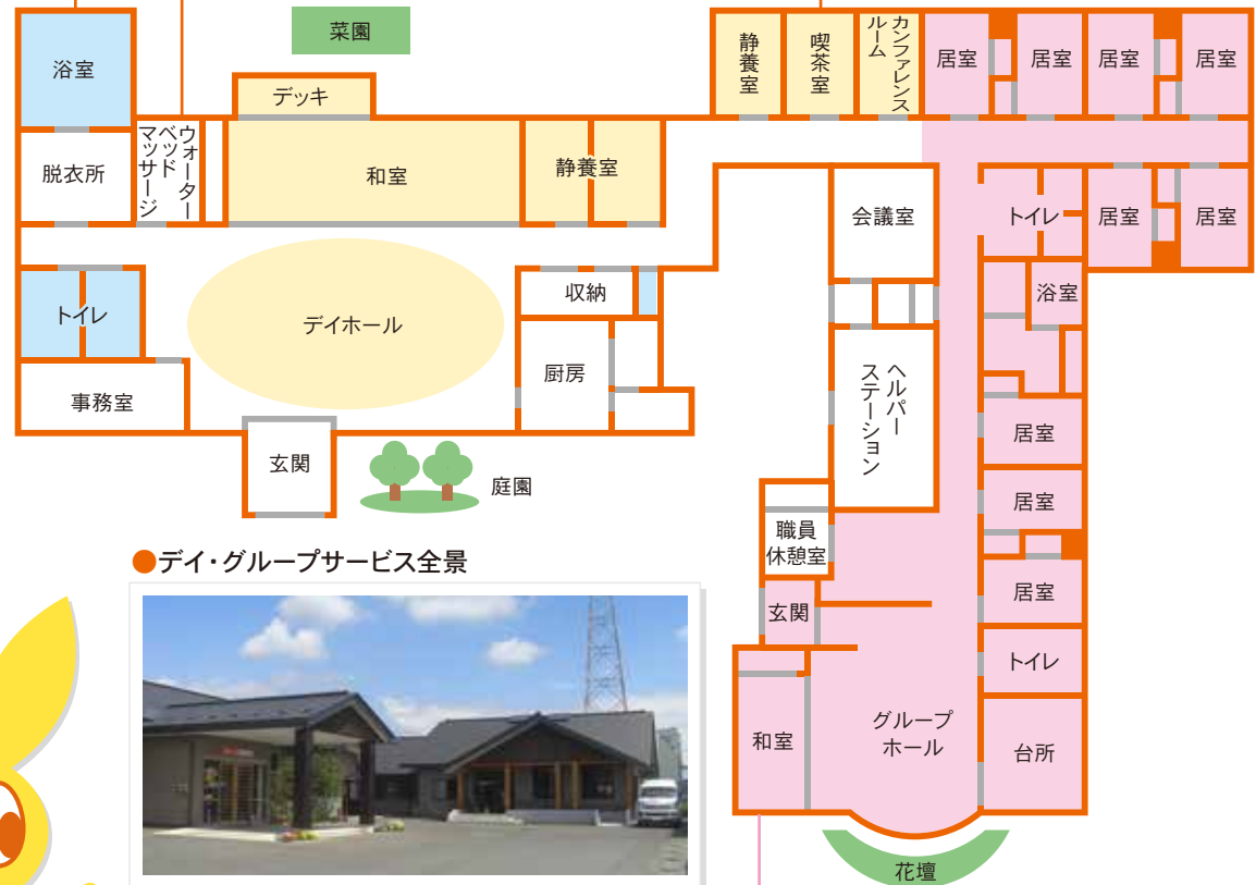
● デイ・グループサービス全景