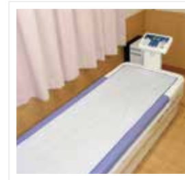
● ウォーターベッドマッサージ機